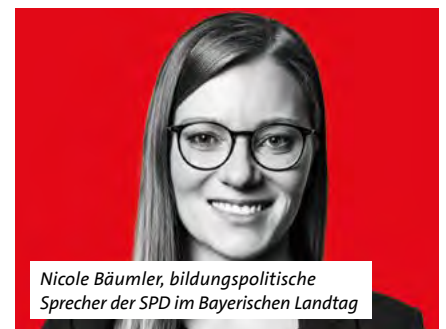
Nicole Bäuml, bildungspolitische Sprecherin der SPD im Bayerischen Landtag